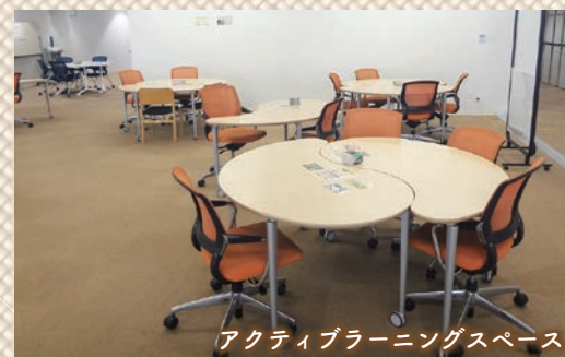
アクティブラーニングスペース