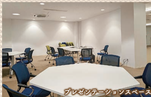
プレゼンテーションスペース